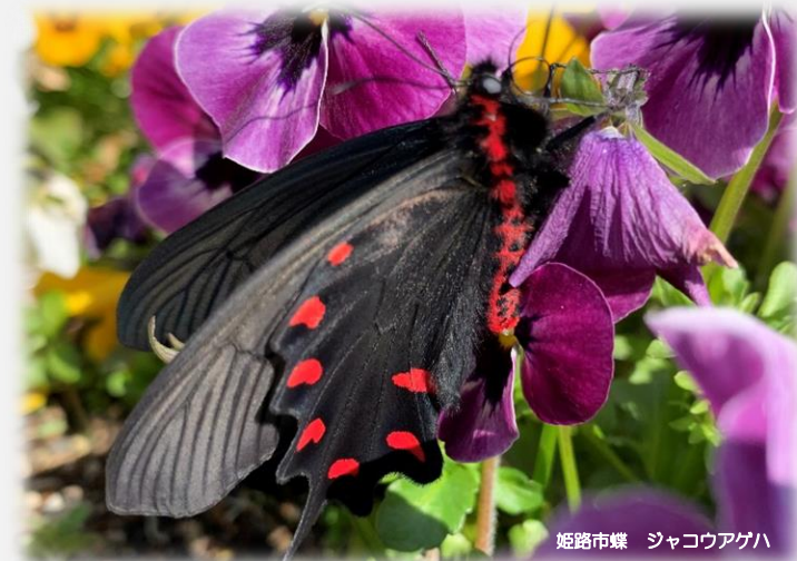
姫路市蝶 ジャコウアゲハ