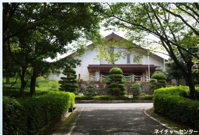
ネイチャーセンター

展示室には写真パネルなどの展示物のほかに、およそ850冊の図鑑などの書籍がそろっています。観察路で出会った生き物などについて詳しく調べることができます。