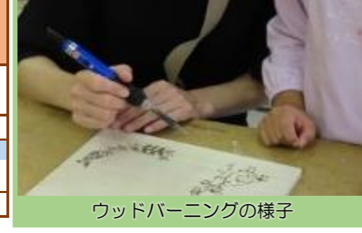
ウッドバーニングの様子