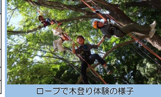
ロープで木登り体験の様子