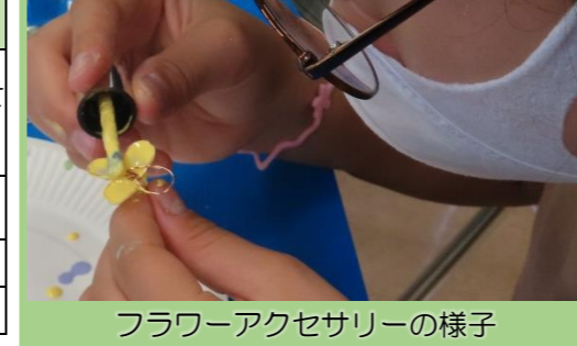
フラワーアクセサリの様子