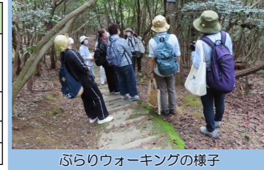
ぶらりウォーキングの様子