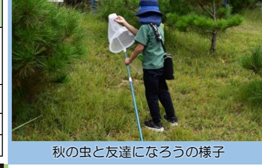
秋の虫と友達になろうの様子