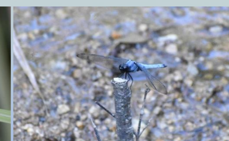
オシオカラトンボ