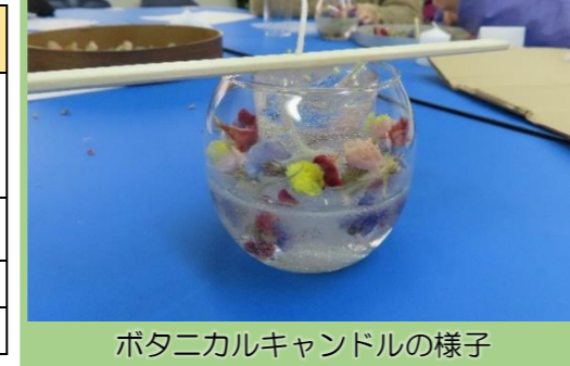
ボタニカルキャンドルの様子