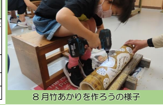
8月竹あかりを作ろうの様子