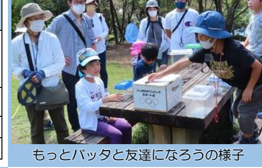
もっとバッタと友達になろうの様子