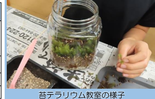
苔テラリウム教室の様子