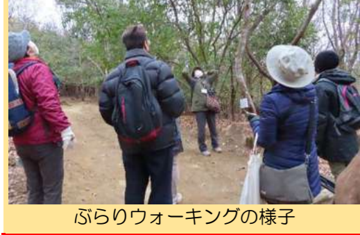
ぶらりウォーキングの様子