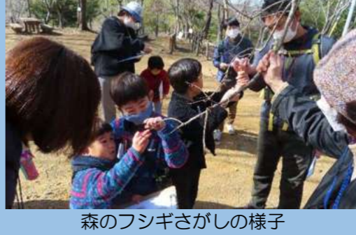
森のフシギさがしの様子