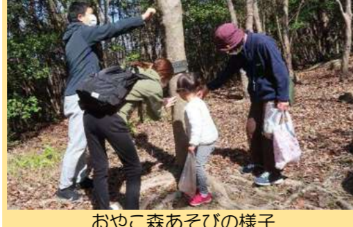
おやこ森あそびの様子