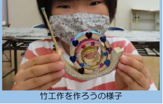
竹工作を作ろうの様子