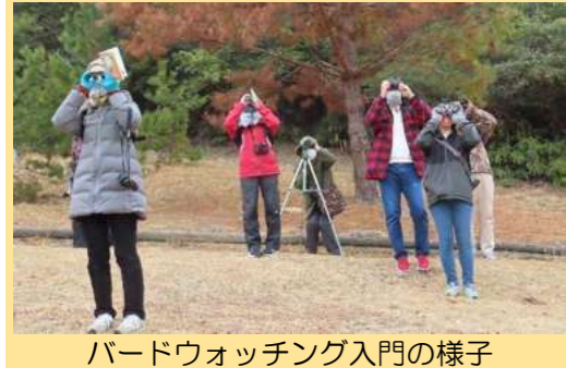
バードウォッチング入門の様子