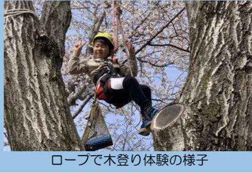
ロープで木登り体験の様子