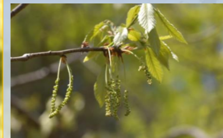
コナラ（どんぐりの木）の花