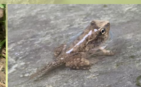
ニホンアカガエルの幼体