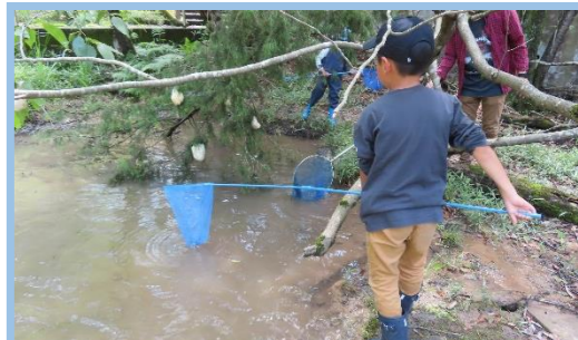
梅雨時のいきものウォッチングの様子