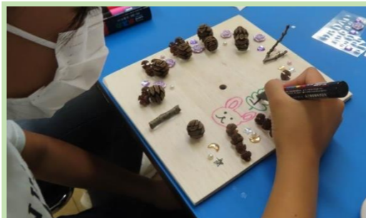
木工クラフト教室(時計編)の様子