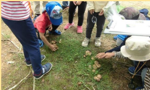
森のフシギさがしの様子