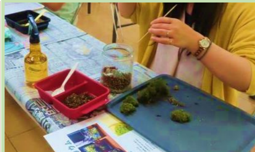
苔テラリウム教室の様子