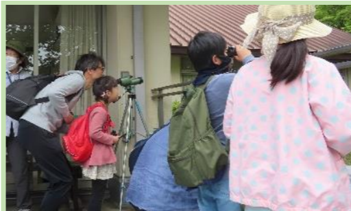
バードウォッチング入門の様子