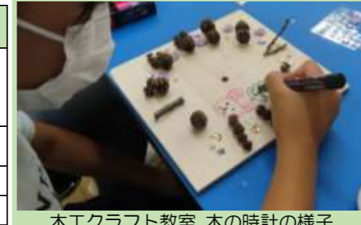
木工クラフト教室 木の時計の様子