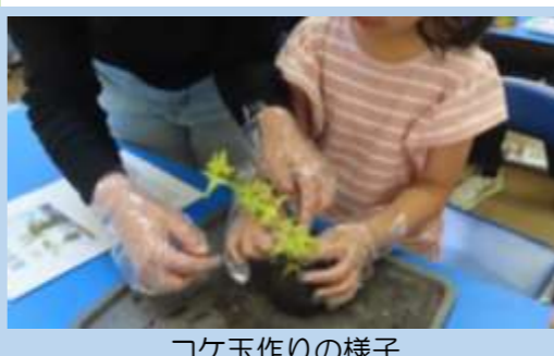
コケ玉作りの様子