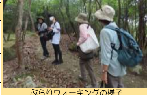
ぶらりウォーキングの様子