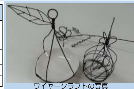
ワイヤークラフトの写真