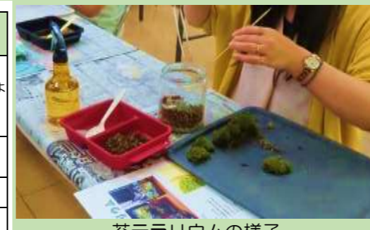
苔テラリウムの様子