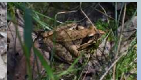
ニホンアカガエル