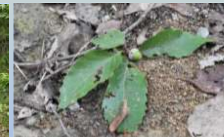
ハイイロチョッキリのおとしもの