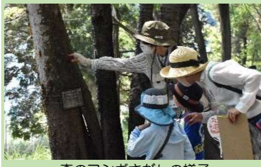
森のフシギさがしの様子