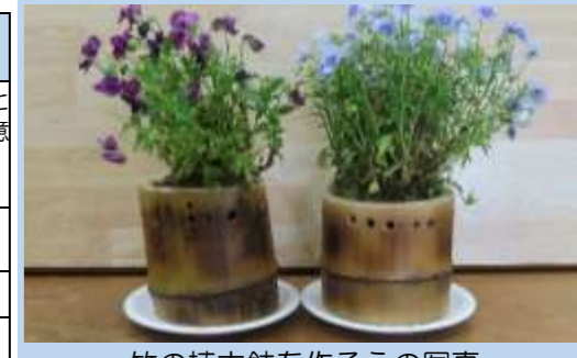
竹の植木鉢を作ろうの写真