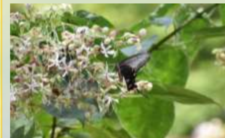
クサギの花にジャコウアゲハ